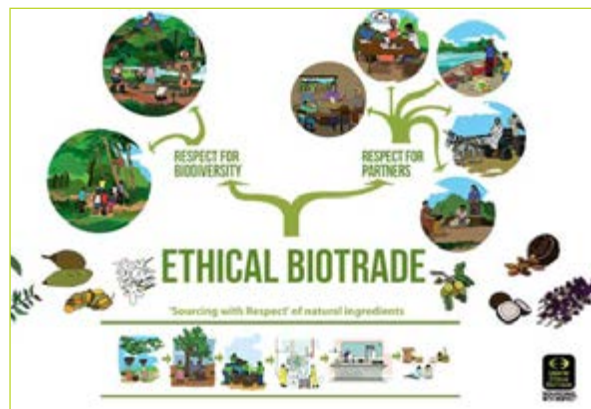
Kit Comunidade: um conjunto de ferramentas da UEBT para aprendizagem e capacitação para as comunidades locais.