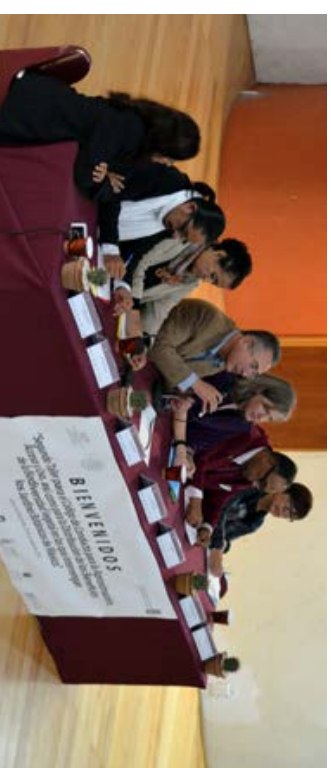
Presidium del acta inaugural Segundo Taller "Código de Conducta y Guía de Buenas Prácticas para el Acceso y Participación de los Beneficiarios de la Biodiversidad en los Jardines Botánicos de México" Oaxaca, Oaxaca. Foto: Guiliani López.

Los recursos genéticos vegetales pueden ser objeto de procesos de investigación de sus propiedades benéficas. El uso no comercial tiene como finalidad el incremento del conocimiento y entendimiento del mundo natural, con actividades desde determinación taxonómica y sistemática hasta análisis de ecosistemas y la conservación de las especies, incluyendo ecología, genética, morfología, fisiología, biología molecular, genómica, genómica ambiental y ciencias relacionadas con el uso sostenible, entre otras disciplinas. En términos del quehacer de los Jardines Botánicos, el uso no comercial incluye también la propagación y exhibición del material. En términos más amplios, puede incluir técnicas tales como preparaciones anatómicas y citológicas, análisis de isótopos, muestreo de polen, esporas y/o compuestos químicos, así como análisis y la obtención de secuencias de ADN, ARN, proteínas y otras biomoléculas.