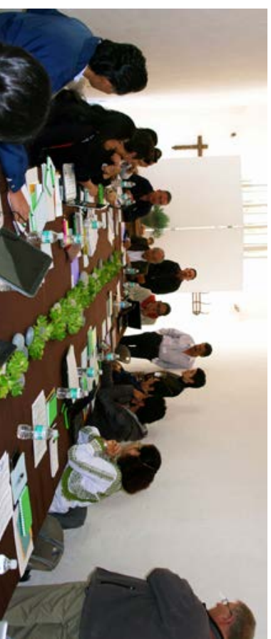
Sesión de trabajo del Primer Taller de Consulta para el Código de Conducta. Abril de 2015. Bernal, Querétaro.