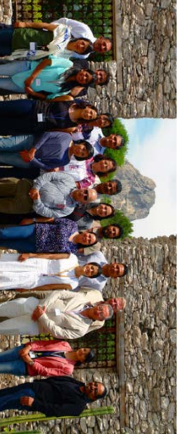
Primer Taller de Consulta para el Código de Conducta, Abril de 2015, Bernal, Querétano. Grupo de trabajo Foto: Hugo Altamirano Vázquez.