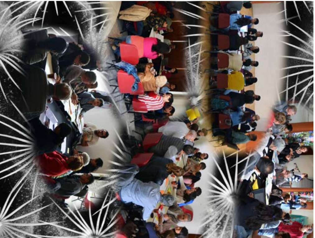
Aspecto de las mesas de trabajo con los integrantes de la Asociación Mexicana de Jardines Botánicos, A.C. Segundo taller "Código de Conducta y Guía de Buenas Prácticas para el Acceso y Participación de los Beneficios de la Biodiversidad" en los que intervengan los Jardines Botánicos de México". Oaxaca, Oaxaca.

sin contemplar explotación comercial. Estará sujeta a la legislación vigente en la materia y requiere de CFPJ. 3. Investigaciones de largo plazo. Es recomendable que entre los jardines botánicos y los poseedores o propietarios de los recursos, se produzca una búsqueda y desarrollo de beneficios mutuos de carácter permanente y solidario, que tengan por objetivo el desarrollo de medios de vida sustentable en las comunidades.