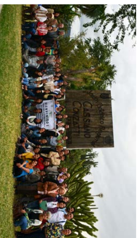
Fotografía del grupo al completo. Segundo Taller "Código de Conducta y Guía de Buenas Prácticas para el Acceso y Participación de los Beneficiarios de la Biodiversidad en los Jardines Botánicos de México" Oaxaca.